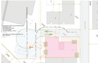
Machbarkeitsstudie Bürohaus Güterstrasse 22 Bern

betreuen AUSBILDUNG | FREIZEIT | GESUNDHEIT