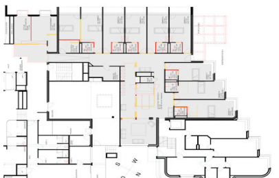
Machbarkeitsstudie Einbau Demenzabteilung Altersheim Wabern