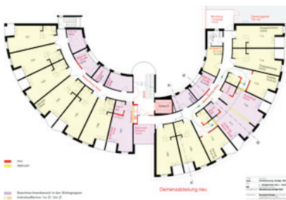
Machbarkeitsstudie Einbau Demenzabteilung Worb-Vechigen